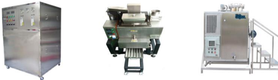
순수 제조 장비, 폐 납 재생 장비, 폐 솔벤트 재생 & 폐 수 처리 장비

전자, 반도체, 정밀금속 제조, 유지보수 및 테스트 시에 사용되는 순수를 처리하는 장비로서 수돗물에 함유된 이온입자 및 기타 유.무기 오염물을 완전 제거하여 순수를 만드는 장비이다.