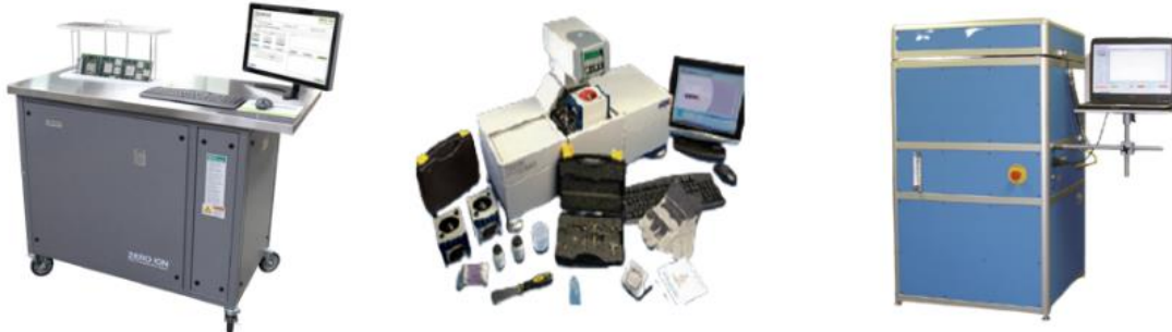
Mil Spec. & IPC 규정 이온 오염도, 납땜성, 리플로우 시뮬레이션 장비

4차 산업 혁명의 시대와 더불어 첨단화, 고 집적화 하는 전자 반도체 제조 환경에서 국민의 생명과 안전, 고가의 재산을 보호하기위한 PCB controller & Package의 장기 신뢰성을 테스트하기 위한 장비로서 장기 부식 및 ECM(Electro-Chemical Migration) 현상 등을 미연에 방지하기 위한 이온 오염도/세정정도 측정, 납땜성 테스트, 표면절연저항, 전도성 양극 필라멘트 테스트 및 Reflow Simulation 테스트 장비 이다.