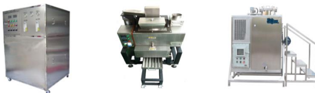
순수 제조 장비, 폐 납 재생 장비, 폐 솔벤트 재생 & 폐 수 처리 장비