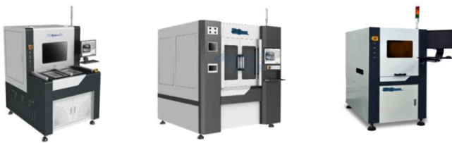
Laser 마킹, 커팅 & PICO Laser Ceramic, Glass & Sapphire 커팅 장비