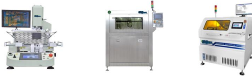
BGA & SMT Rework 장비, Selective Soldering & 지그 수 세정 장비

방산(육. 해. 공), 철도, 항공, 선박, 자동차, 우주 및 플랜트 기기 탑재 용 PCB controller에 탑재된 BGA, SMT 부품의 유지보수를 위한 수리장비로서, 수 작업이 아닌 정밀 구현되는 온도프로파일에 의해 부품 수리, 정밀 금속 부품, Duro-Stone, 작업 지그, 작업 팔렛트 등을 친 환경 물을 사용하여 정밀 세정하는 장비로서 세정 - 행금 - 건조 일괄 자동 세정이 가능하다.