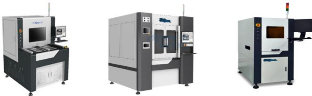
Laser 마킹, 커팅 & PICO Laser Ceramic, Glass & Sapphire 커팅 장비

기존의 환경오염 및 인체 유해 약품을 사용한 마킹, 기계적인 장치를 사용하여 마찰 및 열 변형을 유발하던 커팅 방식을 대체하는 Laser 또는 PICO Laser를 응용하여 금속, 비철금속, 플라스틱 및 고무 등의 다양한 재료에 적용 가능한 마킹과 커팅을 할 수 있는 장비이다.