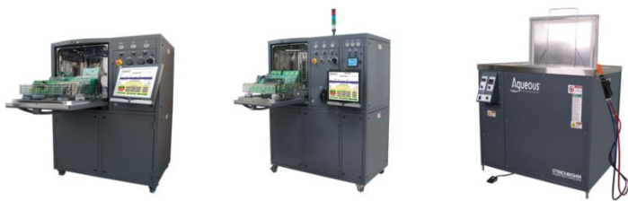
친 환경 PCB, PCBA, SMT, LED, Stencil, Package 수 세정 장비

08 mil spec. & IPC 규정 컨포멀 코팅 제거, 리드포밍 & IC Package 디캡 장비