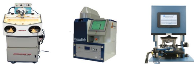
Mil Spec. & IPC 규정 컨포멀 코팅 제거 , 리드포밍 장비 , IC 디켄 장비