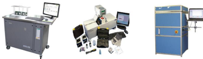
Mil Spec. & IPC 규정 이온 오염도, 납땜성, 리플로우 시뮬레이션 장비