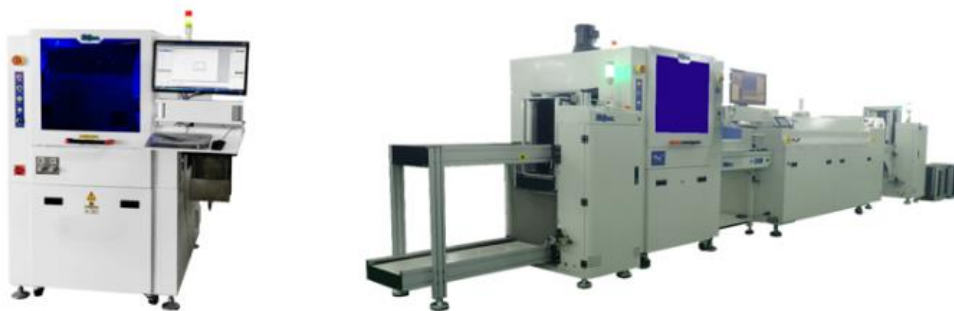
인 라인 Conformal Coating, UV & IR Curing 장비

절연, 방습, 방진 등으로부터 PCB, SMT & Package를 방지하고 장기 신뢰성을 확보하기 위해 실리콘, 아크릴 및 우레탄 코팅제를 자동 도포하는 장비로서 인 라인 장비로서, 로더 - 컨포멀 코팅 - UV 검사 - UV & IR 경화 - PCBA 반전 - 언 로더로 구성된다.