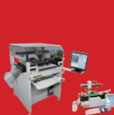
다 품종 소량 생산 Pick & Place System

친환경 종합 Solution을 공급합니다! Expert of Laser Marking, Cutting, Soldering, Cleaning, Engraving, Welding & Measurement